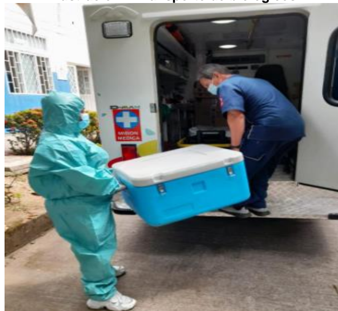
Ilustración 2 Transporte de biológicos